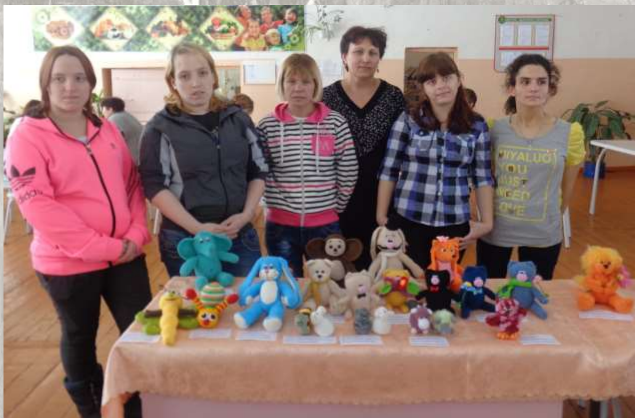
Выставка наших поделок