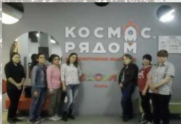
Познавательно-развлекательный музей « Джоуль парк» г. Омск