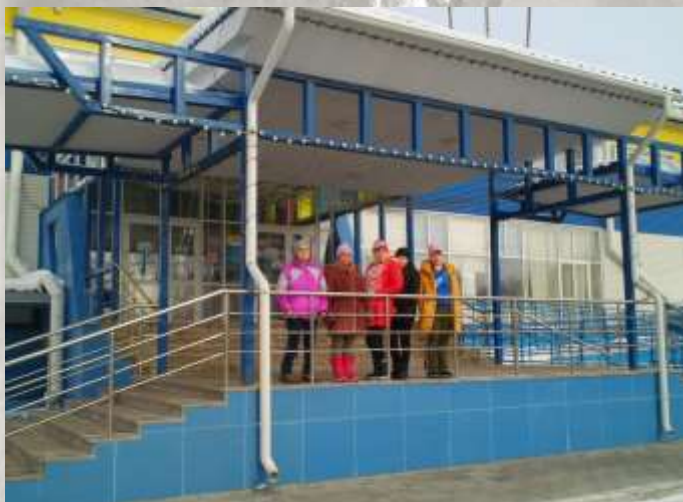
Акварпарк «АкваРио» г. Омск