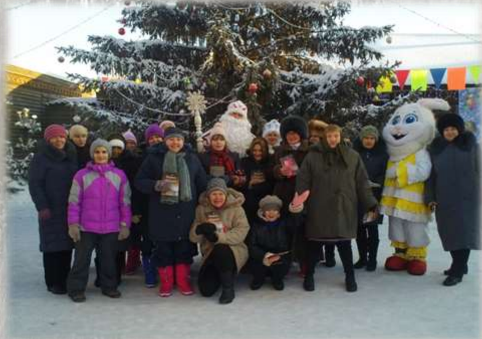
На экскурсии в Старине сибирской