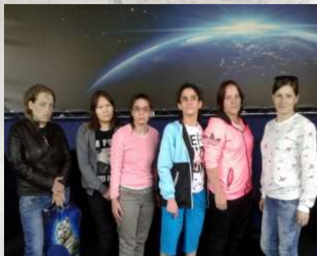
Кинотеатр «Космос»р.п. Большеречье